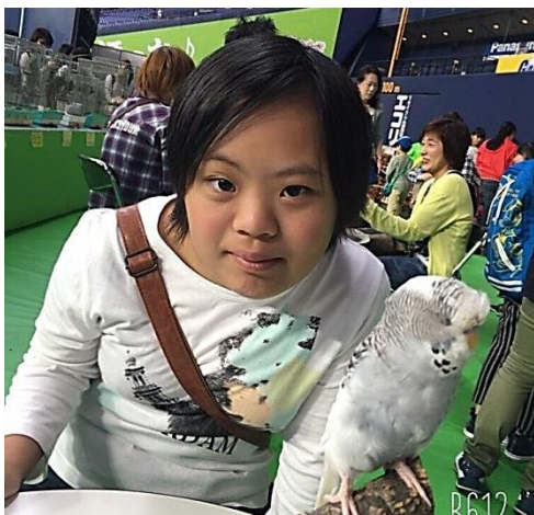
【高1の頃、京セラドームのペット博にてインコと♡】

小さいころから学校やデイサービスが大好きで、毎日元気に通ってくれました。性格は努力家で、いつも笑顔。そして、とても優しい娘です！大切にしていることは「健康第一！」休日はできるだけ体を動かす