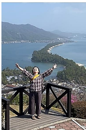
【3月に訪れた天橋立】

いまさらおススメするまでもありませんが、今回は《旅》にしました。旅にはストレス軽減や心身の癒しに大きな効果があります。また、行程の下調べや荷物の準備などは一種の脳トレ。物理的な距離などに関係なく、旅の幸福感は約8週間も続くと言わ