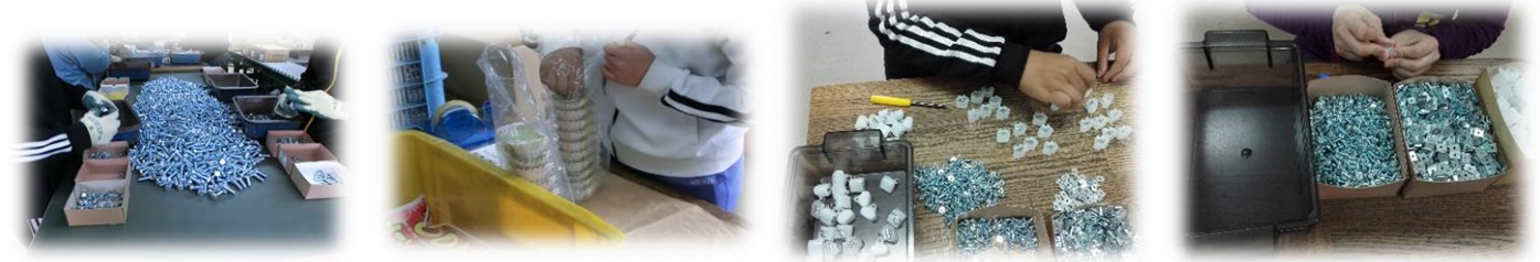
ボルトナットの組み立て アルミカップの袋入れ カーテン部品の組み立て