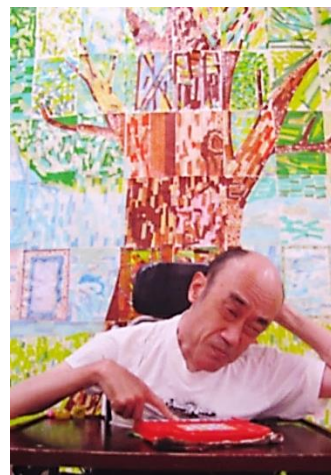
【作業所のお楽しみ会／みんなで作った作品の前で】

昨年2月にはお父さんが亡くなり、淋しくなりました。早くコロナが収束して自由に面会できることを願っています。