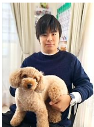
【トイプードルのNONちゃんと】

人と話すのが苦手、あまり会話が無いのですが、時々TVやスマホなどで知った情報を嬉しそうに…楽しそうに教えてくれる時があり、そういう笑顔がもっと増えたらいいなと思います。