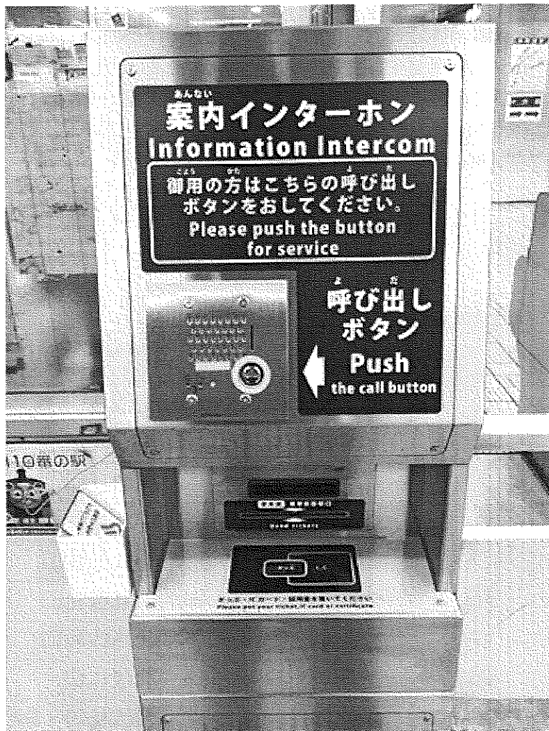
【遠隔案内システム取り付けイメージ】